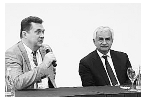
Пресс-конференция президента Абхазии Рауля Хаджимба