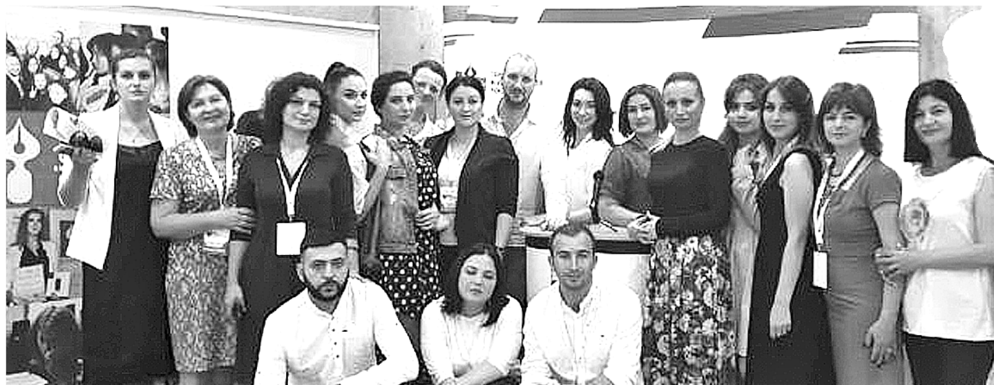
Коллективное фото на память

...Большой и шумный корабль под названием «Союз журналистов» выполнил свою созидательную миссию, и именно поэтому форум «Вся Россия – 2018» стал