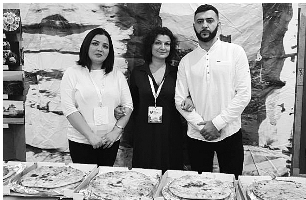
Осетинские пироги понравились всем!

тических страниц, много критики. Освещаются такие востребованные темы, как экология, прошлое, судьбы, здоровье и спорт, дети. Словом, из муниципальных газет есть что почерпнуть.